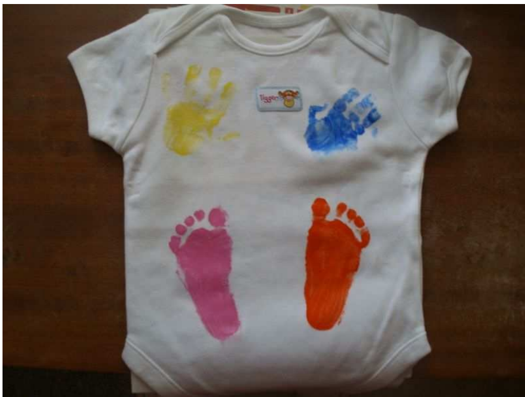
Akce Tiskání nožiček miminek

Všem nadšencům, dobrovolníkům „bez papíru“ a pomocníkům, bez kterých by to opravdu nešlo.