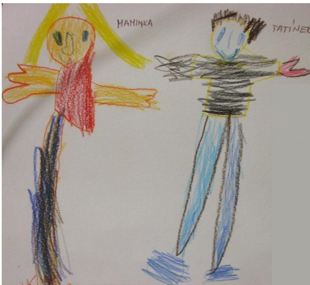
Obrázek od Veroniky Vítkové k Národnímu týdnu manželství 2010